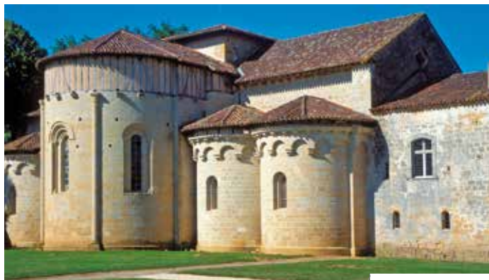
Abbaye de Flaran